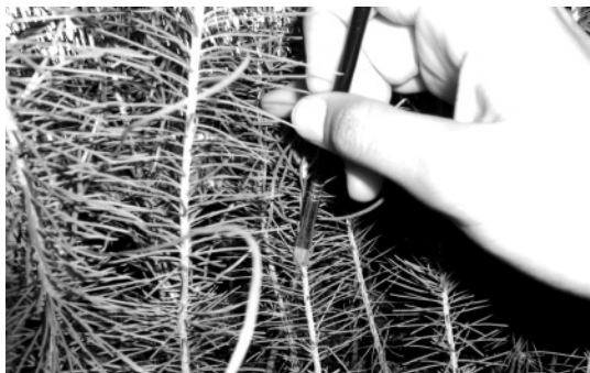
Figura 1. Aplicación de tratamientos mediante el pincelado del tallo de una planta de Pinus pinaster