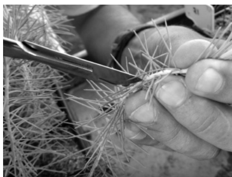
Figura 2. Inoculación con Fusarium circinatum poniendo en contacto micelio del hongo sobre incisiones longitudinales de 1 mm practicadas con bisturí a 10 cm del suelo, en el tallo verde de Pinus pinaster (MUÑOZ Y AMPUDIA, 2005)

(1), acículas verdes y necrosis sólo en el punto de inoculación; (2) acículas verdes y necrosis superior a 2 cm en las proximidades del punto de inoculación; (3) acículas y/o brotes marchitos, y necrosis anillando el brote; y (4) brote anillado y follaje muerto desde el extremo distal al punto de inoculación. Debido al reducido tamaño de los tallos no se pudo cuantificar la necrosis de las plántulas. A las 8 semanas de la inoculación se realizó una evaluación final de los daños y posteriormente se constataron los postulados de Kock reaislando el patógeno F. circinatum en medio selectivo K (KOMADA, 1975). Al final del experimento todo el material utilizado (sustrato incluido) fue esterilizado y el interior del invernadero reiteradamente pulverizado con Captan (RAMÓN-ALBALAT et al. , 2010).